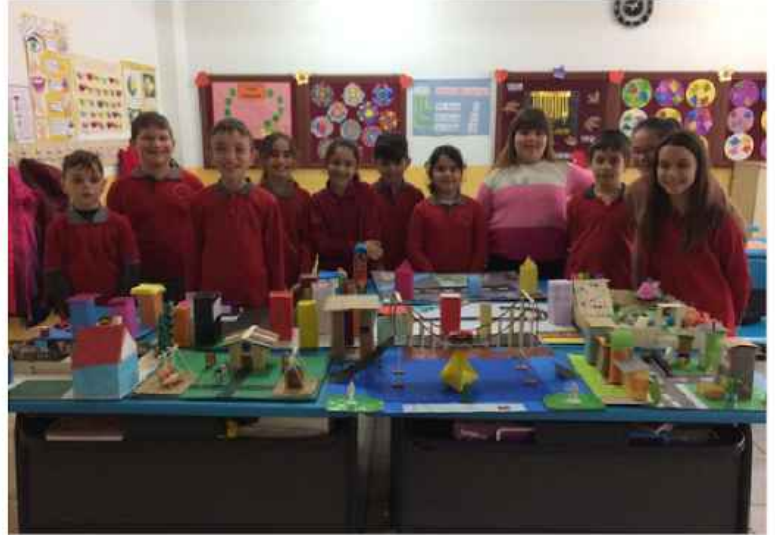
3/E Sınıfı öğrencilerimizin yapay çevre tasarımları.